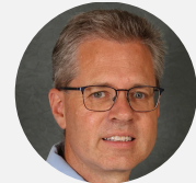
PROFESSOR PIETER DE WILDE